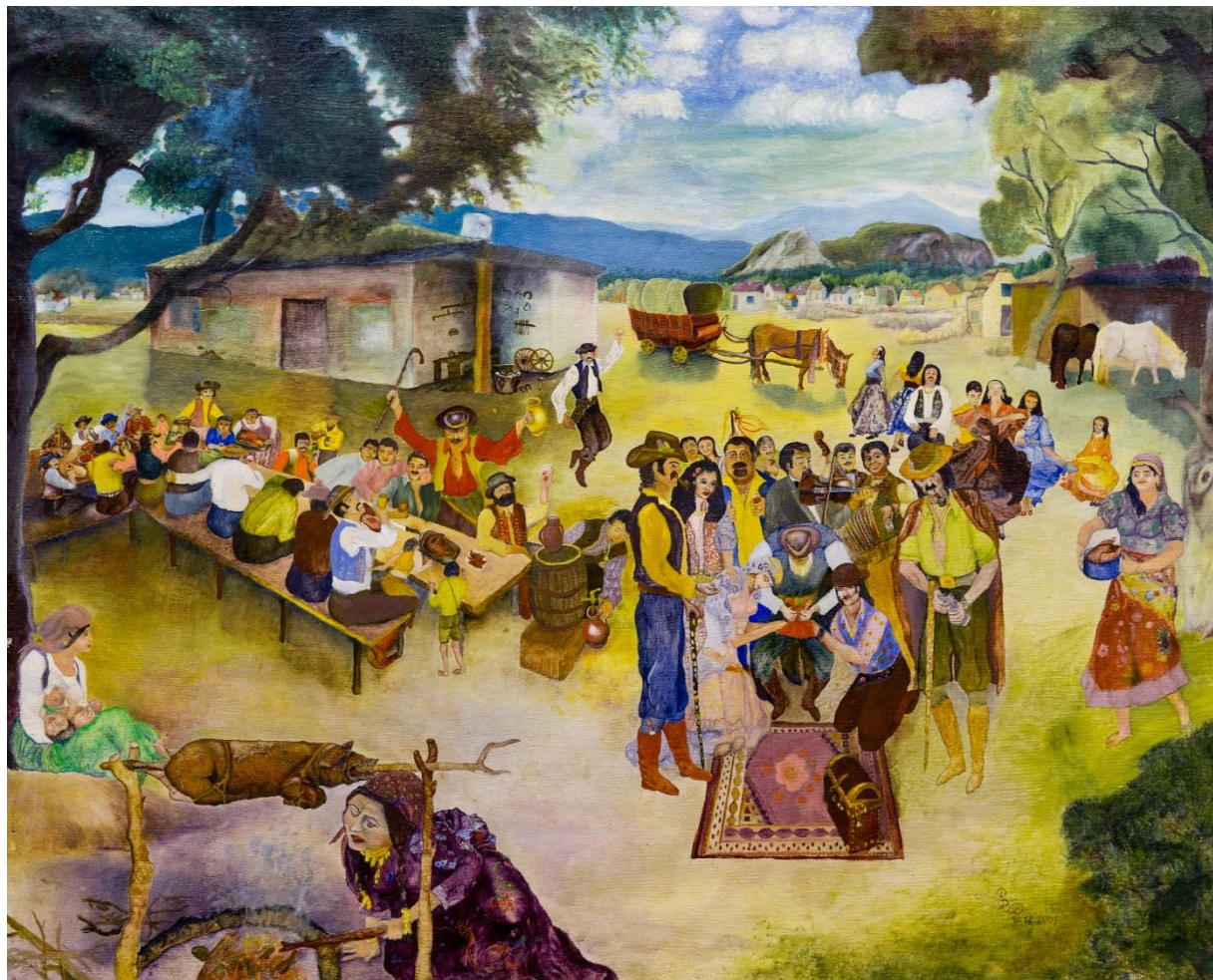
Rudolf Rác – Romská svatba, olej na plátně, umístěno ve stále expozici MRK